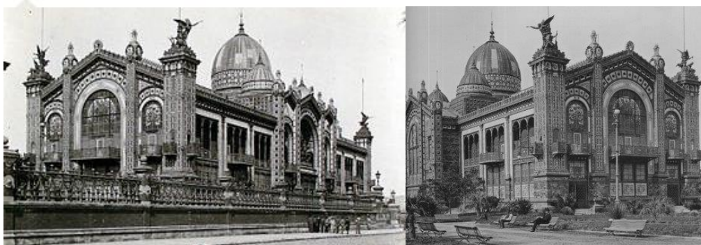
Vistas externas del Pabellón Argentino

En conmemoración del Centenario de la Revolución Francesa, se llevó adelante la Gran Exposición Universal de las Naciones de París, desde el 5 de mayo al 31 de octubre de 1889. Argentina fue invitada oficialmente en 1886 y con ella 35 países se sumaron a los festejos, construyendo enormes pabellones en donde cada nación mostraba sus riquezas naturales, su progreso, desarrollo económico y nivel cultural.