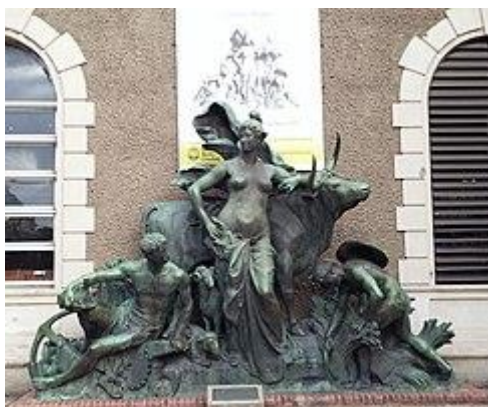
Escultura “La República Argentina” ubicada en la Escuela Técnica Raggio

esculturas, siendo la más importante la denominada “ La República Argentina ”, obra original del escultor Jean Baptiste Hugues 7 .